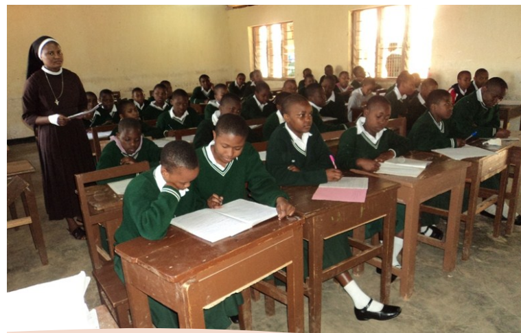
KLABU YA KINDOROKO WAKIWA KWENYE MAFUNZO YA UKIMWI