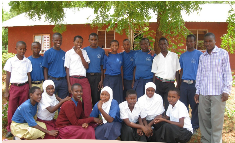
KLABU YA KIGONIGONI SEKONDARI