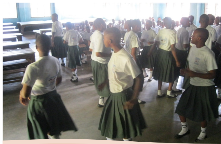
KLABU YA MVURE SEKONDARI,5) KLABU YA KINDOROKO WAKIFIKISHA UJUMBE WA UKIMWI KWA NYIMBO