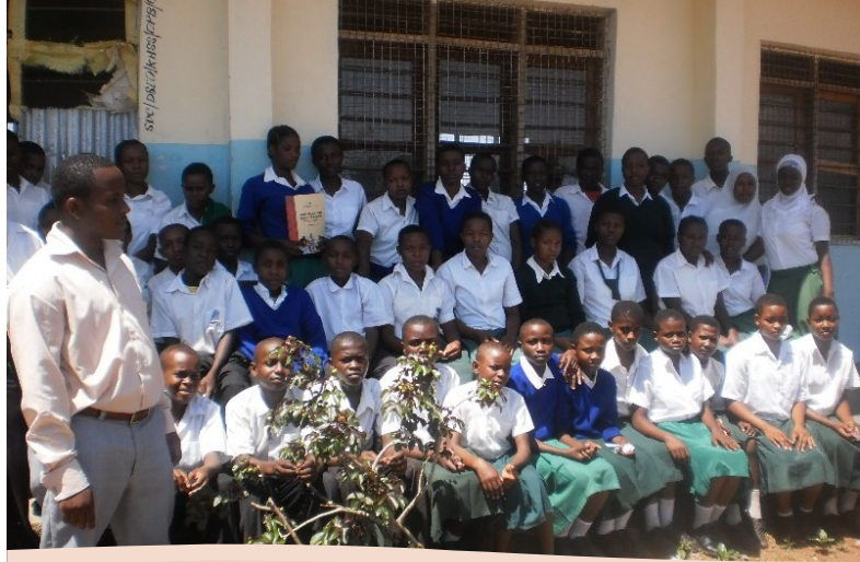
KLABU YA JITENGENI SEKONDARI