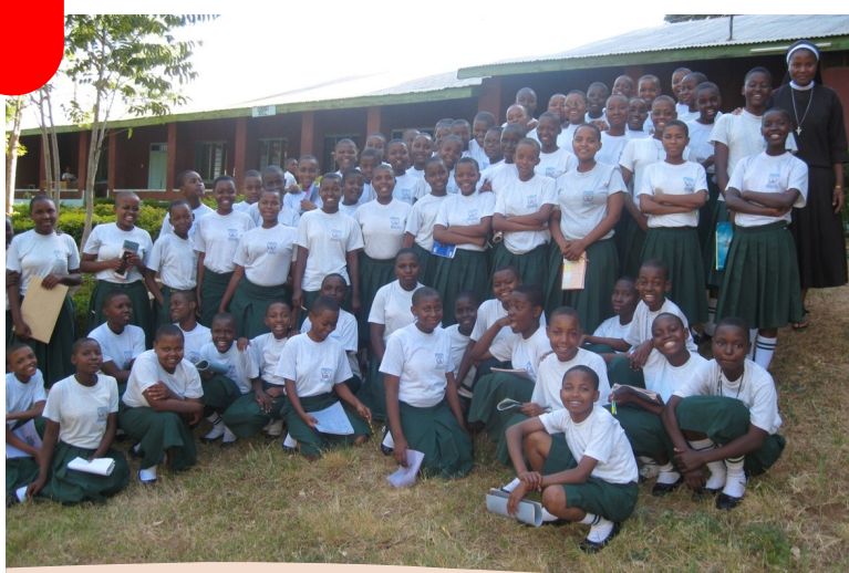
KLABU YA KINDOROKO SEKONDARI