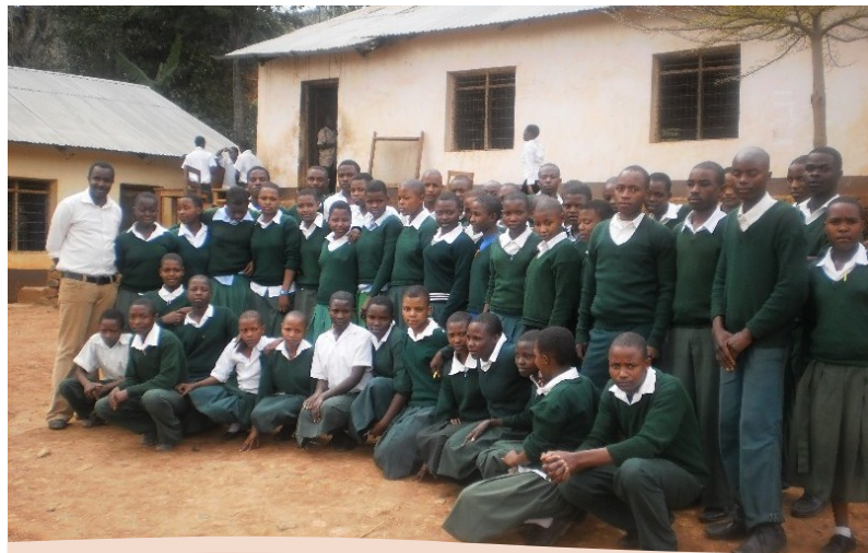
KLABU YA KWANGU SEKONDARI