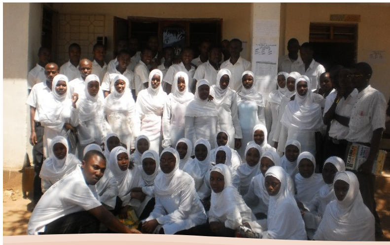
KLABU YA VUDEE SEKONDARI