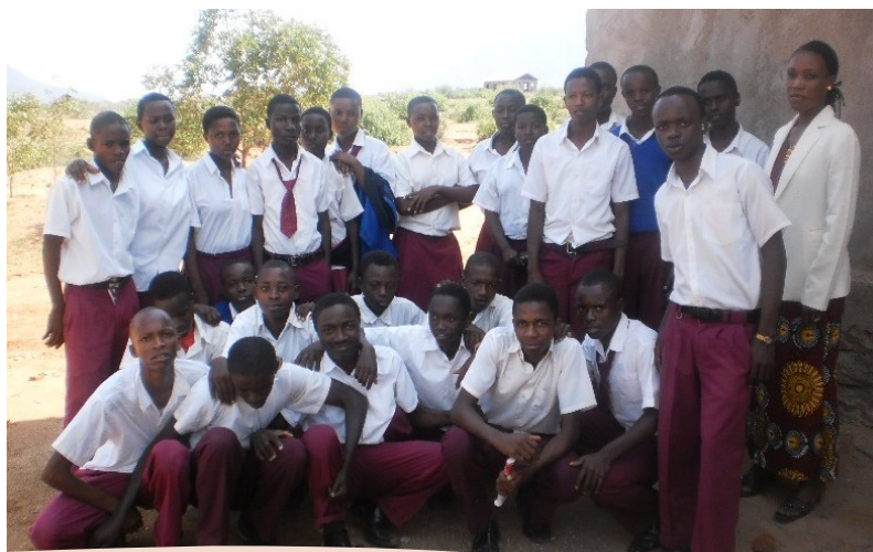
KLABU YA NGUJINI SEKONDARI