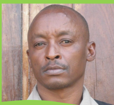
ALPHONCE SAMBURA Mkuu wa Idara ya Mazingira na Mabadiliko ya Tabia Nchi