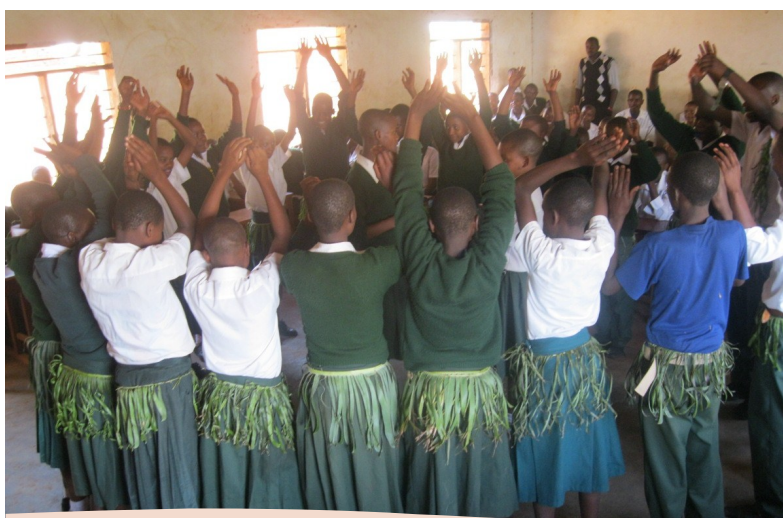
KLABU YA VUDEE SEKONDARI WAKIELIMISHA MASWALA YA UKIMWI KWA NGOMA