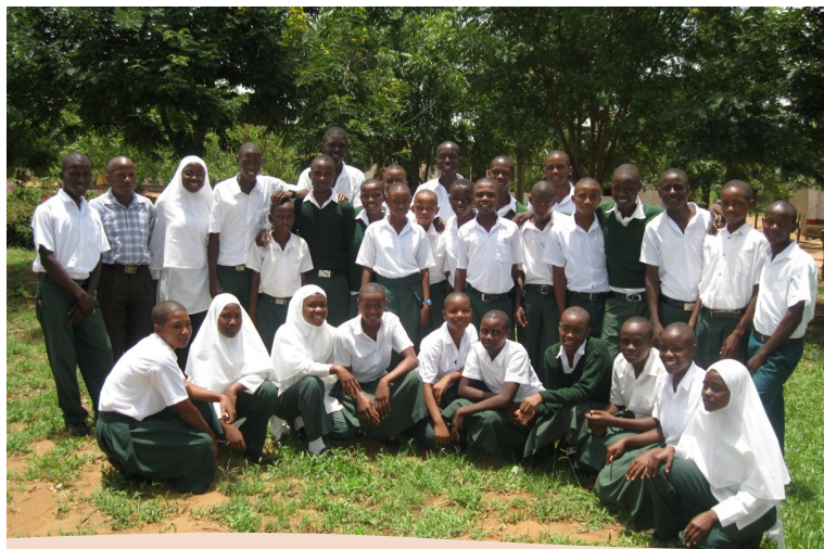
KLABU YA KIHURIO SEKONDARI