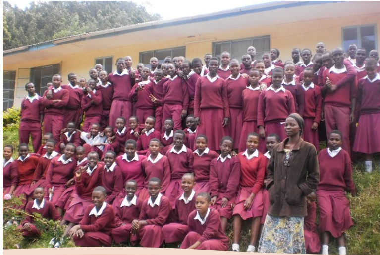
KLABU YA NGUJINI SEKONDARI